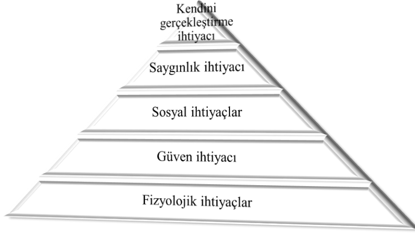
Şekil 2. Maslow'un İhtiyaçlar Hiyerarşisi

geçebilmesi için mevcut ihtiyacının giderilmesi gerekmektedir. Bu nedenle öncelikli olarak bulunulan basamaktaki ihtiyaçlar giderilmelidir.