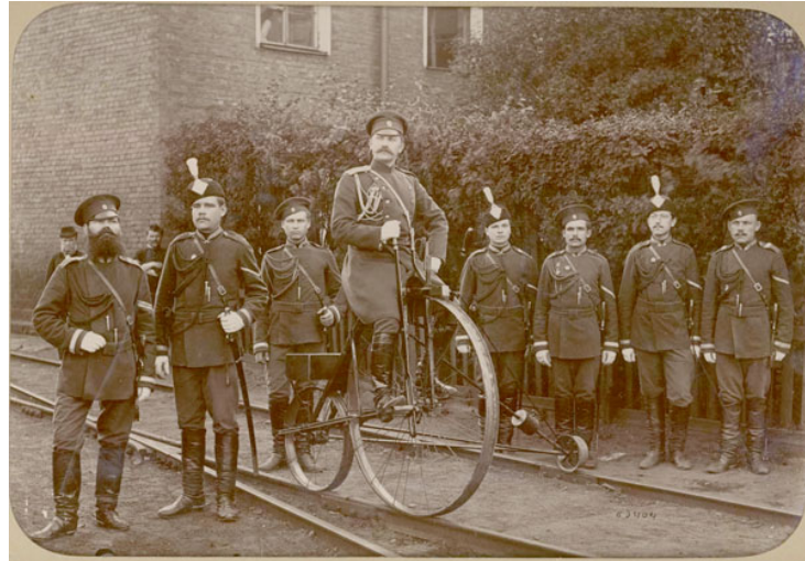
Şekil 2: Demiryolu bisikletinin askeri amaçlarla kullanımı.

Askeri amaçlarla savaş zamanı veya diğer zamanlarda demiryolu bisikleti kullanımı hatların denetlenmesi ve bakım ihtiyaçları için müdahale aracı olarak geçmişte kullanılmıştır (Şekil.2).