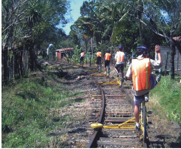
Şekil 5: Demiryolu bisikletinin Sportif amaçlarla kullanımı.

Demiryolu Bisikleti, 15- 20 Km/saat ortalama hızla demiryolu rayları üzerinde hareket etmesini sağlayacak payandalar ve flanşlı tekerlekler takılarak eski bisiklet kullanılarak yapılabilir. Demiryolu Bisikletini demiryolu üzerinde doğrudan binmek için izin özel ekleri ile donatılmış bir sokak bisiklet veya dağ bisikleti olarak tanımlayabiliriz. Normal sokak bisikletini kullanmasını bilmeyenler Demiryolu bisikleti kullanmaları mümkündür çünkü dengede kalmayı gerektirecek durum yoktur.