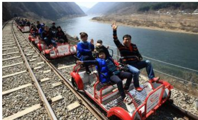
Şekil 5: Demiryolu bisikletinin turistik turlarda kullanımı (www.railbike.com/2015).

Sportif amaçlı kullanımlar bisiklet kullanıcılarının ilgisini çekebilir. Belki küçük ve büyük katılımlı gruplar halinde turlar düzenlenebilir. Kırklareli ilinde giderek yaygınlaşan bisiklet kullanıcıları için yeni ve farklı bir deneyim yaşamak için çok ilginç olmasının yanında giderek yaygınlaşması durumunda çevre illerden katılımcıların buraya gelerek bu farklı deneyimi yaşama isteği, turizm hedefi olarak ortaya çıkabilir. Çocuklar ve yetişkinler demiryolunu çevreleyen doğanın güzelliğinden demiryolu bisikleti gezileri ile eğlence ve macerayı birleştiren sportif bir aktivite mümkün olacaktır. Turizm için bölgenin atıl demiryolu ağının geri kazanımı amacıyla bu hat üzerinde demiryolu bisikleti kiralama istasyonları kurulabilir. Geçmişten günümüze kalan özel mimari görünüşleriyle tren istasyonları restore edilerek yemek yeme, mola istasyonlarına dönüştürülebilir. Belki bu alanlarda şehrin stresinden ve gürültüsünden uzak bir kaç gün geçirmek isteyenler için rahatlatıcı konaklama alanları da yapılabilir. Demiryolu bisikletleri ile raylar üzerinde geziye çıkanların karşı karşıya gelecekleri manzaralı yolculuk sırasında güzel bir gün geçirebilmeleri yanında hat üzerinde yer alan Kanlıgeçit arkeolojik alanı ayrı bir gezi alternatifi alanı olarak da yer alması planlanabilir. Kavaklı beldesinde yer alan Kırklareli Üniversitesi Kavaklı Yerleşkesi sınırlarını takip eden rotada üniversite öğrencilerinin kullanabileceği bir rota oluşturmaktadır.