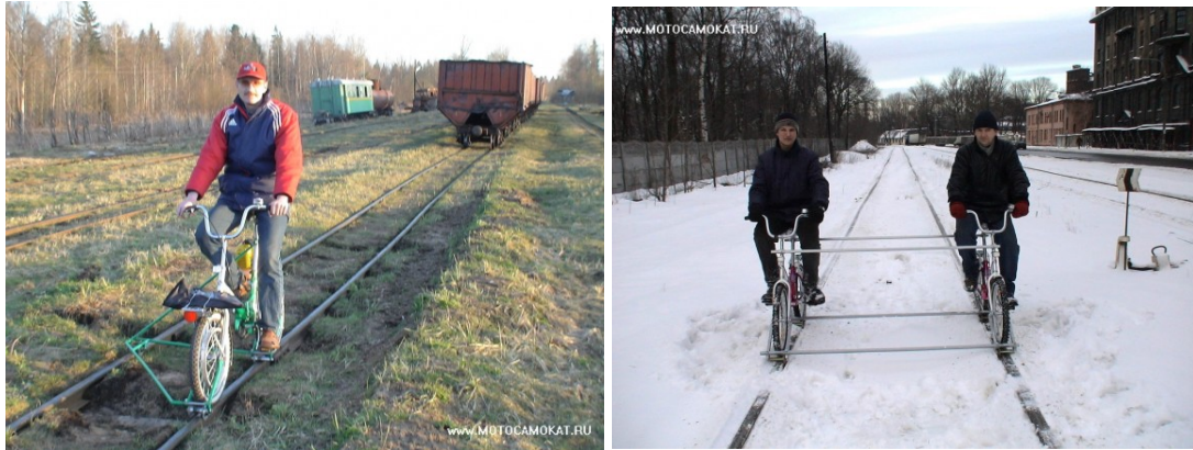
Şekil 4: Demiryolu bisikletinin tek ve çift kişilik kullanımı (www.amurbike.ru/2015).

Leningrad bölgesinde ve Eski Sovyetler Birliği'nin geniş topraklarının tamamında, herhangi bir yolun hiç olmadığı çok farklı yerlerde mantar, çilek toplamak veya yaban hayvanların avcılığını yapmak amacıyla bu büyük ovalardan ve ormanlık alanlardan geçen terk edilmiş demiryolu hatlarının veya halen kullanılmakta olan bölümlerinde demiryolu bisikleti bu fırsattan yararlanmak isteyen kişiler tarafından kolaylıkla kullanılmıştır (Şekil.4) (www.amurbike.com).