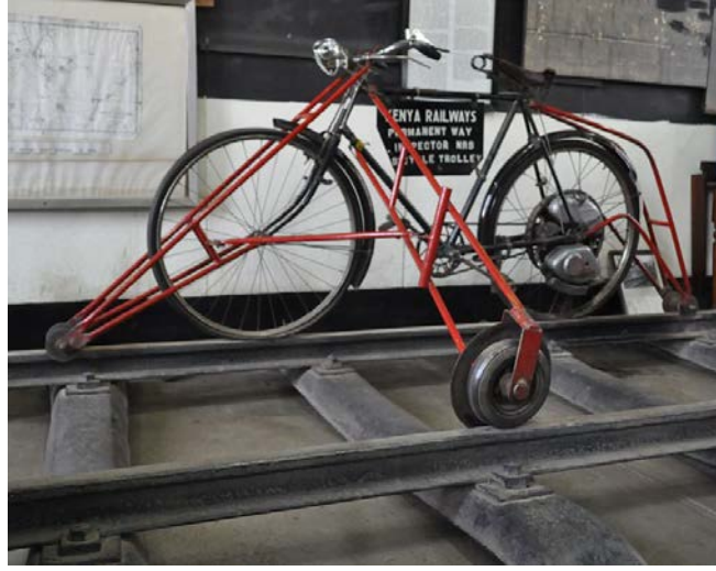
Şekil 1: Kenya’ da demiryolu müzesinde sergilenen geçmişte demiryolu hatlarının bakım ve kontrolünde kullanılan demiryolu bisikleti ( www.ru.wikipedia.org/2015 ).

Askeri amaçlarla savaş zamanı veya diğer zamanlarda demiryolu bisikleti kullanımı hatların denetlenmesi ve bakım ihtiyaçları için müdahale aracı olarak geçmişte kullanılmıştır (Şekil.2).