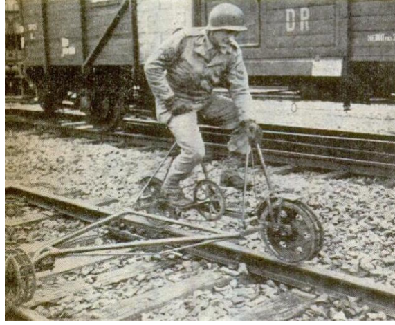
Şekil 3: Demiryolu Bisikletlerinin Dünya savaşında askeri amaçlarla kullanımı (www.shusharmor.livejournal.com/2015).

Leningrad bölgesinde ve Eski Sovyetler Birliği'nin geniş topraklarının tamamında, herhangi bir yolun hiç olmadığı çok farklı yerlerde mantar, çilek toplamak veya yaban hayvanların avcılığını yapmak amacıyla bu büyük ovalardan ve ormanlık alanlardan geçen terk edilmiş demiryolu hatlarının veya halen kullanılmakta olan bölümlerinde demiryolu bisikleti bu fırsattan yararlanmak isteyen kişiler tarafından kolaylıkla kullanılmıştır (Şekil.4) (www.amurbike.com).