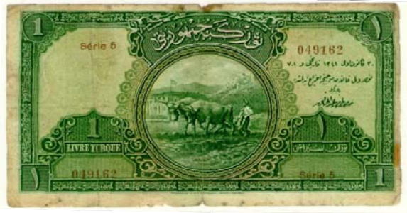
Tasarım 8: E1 Serisinde basılan ve 1927-1937 yıllarında tedavülde olan Zeytuni 1 Türk Lirasının ön yüzü. Design 8: The front part of olive-coloured 1 TL printed in the series of E1 and used between 1927-1937.