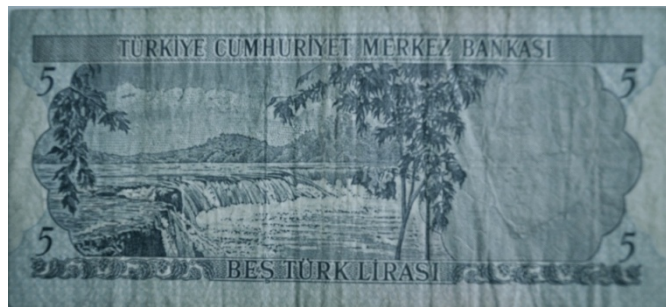
Tasarım 7: E6 Serisinde basılan ve 1966-1983 yıllarında tedavülde olan Eflatun 5 Türk Lirası. Design 7 :Light purple 5TL Printed in the series of E6 and used between 1966-1983