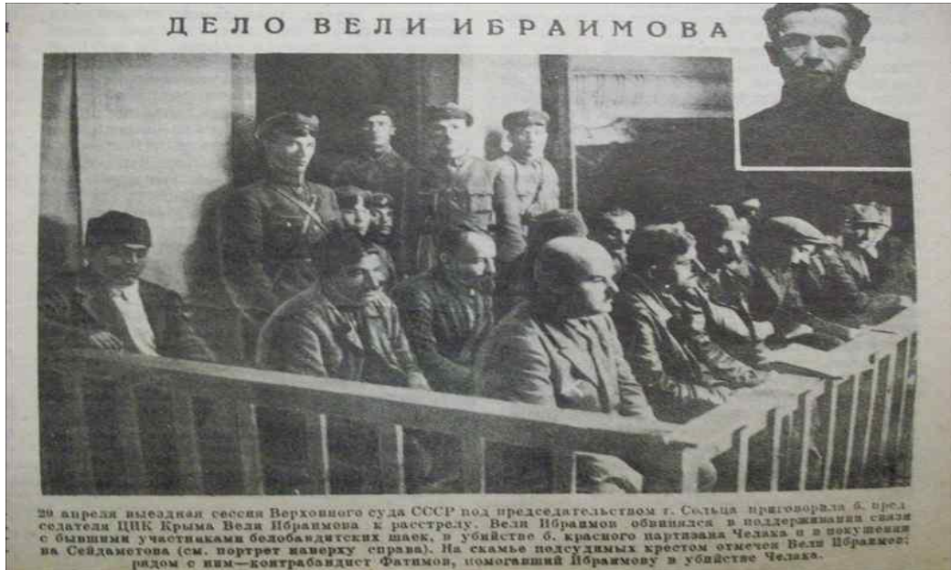
Ek-4: Yargılama Sürecindeki Duruşma Görüntüsü